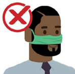
Solo en tu nariz