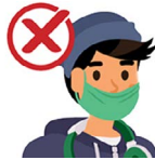
Debajo de tu nariz