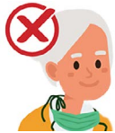
En tu cuello