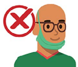
Debajo de tu barbilla