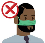
Only on your nose