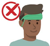
On your forehead