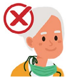
En tu cuello