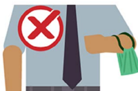
En tu brazo