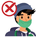
Under your nose