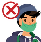
Debajo de tu nariz