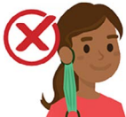
Dangling from one ear